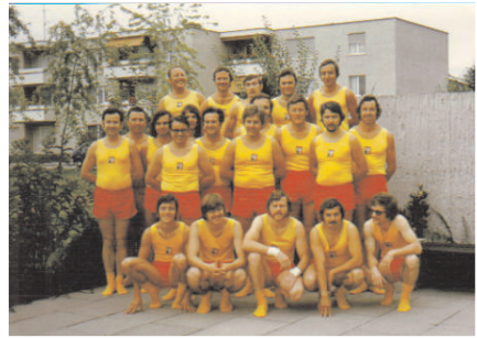
Jahr 1974, Uster,

1973 kamen die Schweizerischen SATUS Leichtathletik-Einzelmeisterschaften auf der Sportanlage "Langriet" zur Austragung. Organisiert vom SATUS Neuhausen wurde diese Veranstaltung zu einer markanten Demonstration des SATUS. Im Jahr 1974 feierte der Zentralverband das 100-jährige Bestehen. Als Jubiläumsveranstaltung wurde in Bern das XIV. Verbandsfest abgehalten, von welchem der SATUS Neuhausen erneut als Festsieger zurückkehrte. Von diesem Erfolg ermuntert, nahmen die Aktiven erstmals an den Schweizer Meisterschaften im Vereinsturnen des Eidgenössischen Turnverbandes teil und erkämpften sich mit