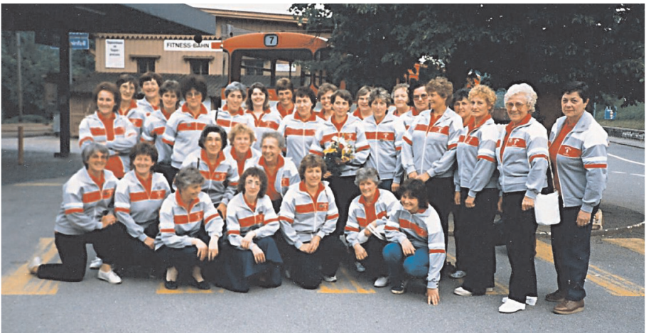
Jahr 1986. Rückkehr vom Frauenriegeltag in Baar

Im Jahr 1994 wurde die bisherige Gasbeleuchtung in der Randenhütte, welche je länger je mehr störanfälliger wurde, durch eine Solaranlage ersetzt. Ansonsten war es ein eher ruhiges Jahr, mit den üblichen vereinsinternen Anlässen. Es wurde mit einer gutgelungenen Abendunterhaltung abgeschlossen. Hier darf auch einmal erwähnt werden, dass an den jährlichen Papiersammlungen immer mehr Altpapier zusammengetragen wurde. Waren es an den ersten Sammlungen (seit 1957) etwa um die fünf bis sechs Tonnen, beträgt die heutige Ausbeute an zwei Sammeltagen (ein Tag im Frühling und Herbst) je um die 100 Tonnen. Ein Umstand, welcher der finanziellen