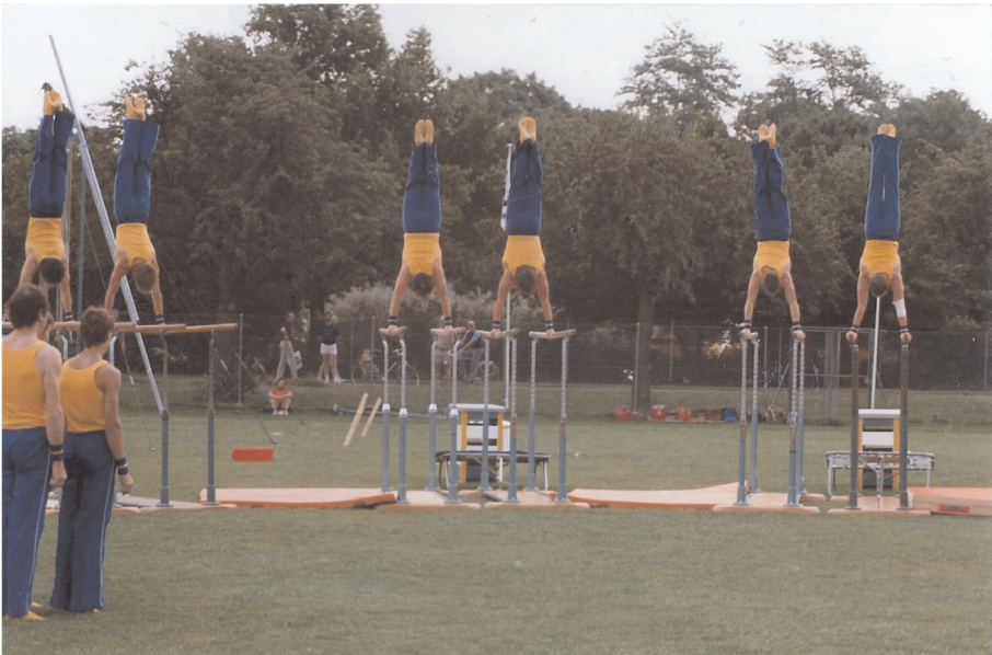
Jahr 1983. Barren am Schweizerischen Verbandsfest in Basel

Als Organisator immer wieder in Erscheinung tretend, wurde 1980 auf