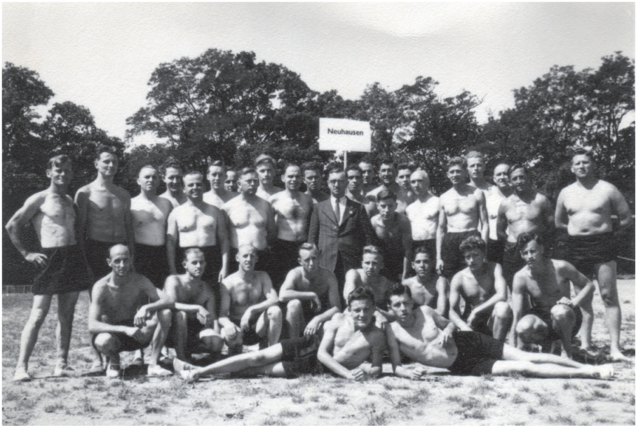
Jahr 1950. Turner am Verbandsfest in Lausanne

der, die würded en Lismer i d'Händ näh oder lerne Kaffi mache ..."