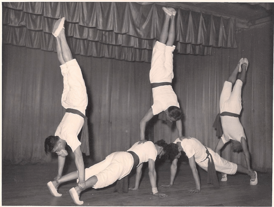
Jahr 1957. Abendunterhaltung im Volkshaus