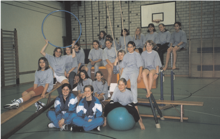
Jahr 2002. Jugi Mädchen gross

An der Generalversammlung 2005 trat die langjährige Oberturnerin zurück. Eine Nachfolgerin konnte nicht gewählt werden. Das 20. Schweizerische Sportfest fand in Olten statt. Für die gutgelungene Gymnastik-Vorführung wurde die Jazzriege schlecht belohnt. In der Kategorie Vereins-