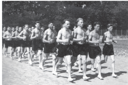
Jahr 1950. Lausanne. Turner im Laufschrift

Besonders in den Jahren 1919 und 1920 erlebte der Verein einen erfreulichen Aufschwung. So kam es nicht selten vor, dass 60 bis 70 Mann die Turnhalle und die Versammlungen besuchten. Das Jahr 1920 brachte das I. Arbeiter-Verbandsturnfest in Luzern, an dem die Sektion mit 42 Mann den Lorbeerkrantz errang. In dieses Jahr fiel auch die Gründung einer Turnerinnenriege, anlässlich einer Versammlung vom 18. September 1920. Die Turnstunden wurden am Samstagabend in der "Kirchacker"-Turnhalle abgehalten. Und im Jahr 1922 wurde ein eigener Vorstand bestellt. Der jungen Riege erging es anfänglich nicht allzu rosig. Das Frauenturnen hatte sich damals noch nicht richtig durchgesetzt. Nicht selten hörte man gerade in Arbeiterkreisen die Worte: "Da fählt jetzt no, da die turned. Es wär geschie-