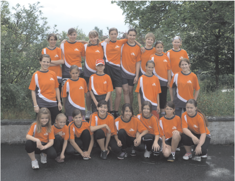
Jahr 2010. Kantonaler Jugendriegentag in Neuhausen

Neuhausen a/Rhf., 18. Juni 2011 Herbert Epprecht