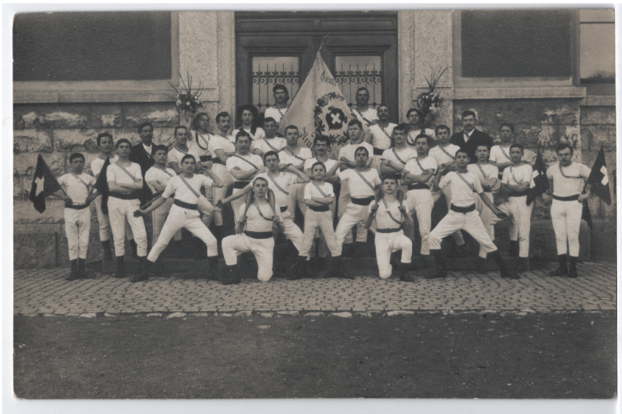
Jahr 1906, Grütli Turnverein, Postkarte

dem Eidgenössischen Turnverband (heute Schweizerischer Turnverband, STV) angehörte. Eine seltsame Zwitterstellung also, die es mit sich brachte, dass die Sektion nicht nur an den Grütli-Turnfesten, sondern auch an fast allen bürgerlichen Festen teilnahm.