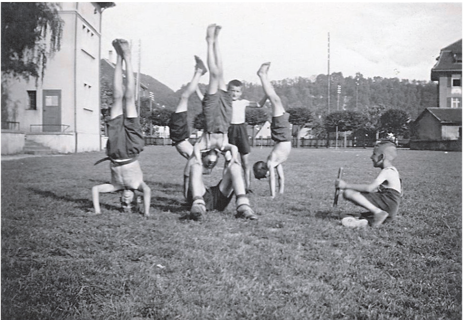
Jahr 1938. Knabenriege auf Kirchackerturnplatz

Schon im Jahr 1890 hatte sich unter den Mitgliedern der Wunsch bemerkbar gemacht, ein Vereinsbanner anzuschaffen, worauf bald ein Fahnen-