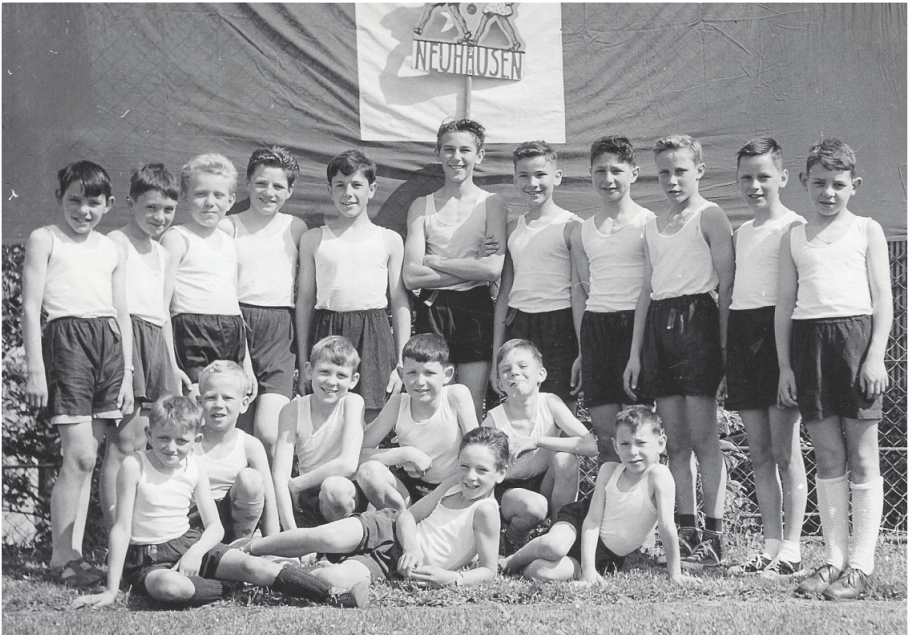
Jahr 1955. Knabenriege am interkantonalen Jugendriegentag in Schaffhausen

Einen prachtvollen Erfolg trug die 46 Mann starke Sektion vom Kreisturnfest in Winterthur 1932 nach Hause, hatte sie doch in der 1. Kategorie den 1. Rang errungen. Die Wirtschaftskrise, die schwer auf der Gemeinde und besonders auf der Arbeiterschaft lastete, ging auch nicht spurlos an der Vereinstätigkeit vorbei. Der Mitgliederbestand, besonders bei den Aktiven, hatte gelitten und war dezimiert worden. Das und schliesslich auch die prekäre Lage des Vereins hatten zur Folge, dass man in diesem und in