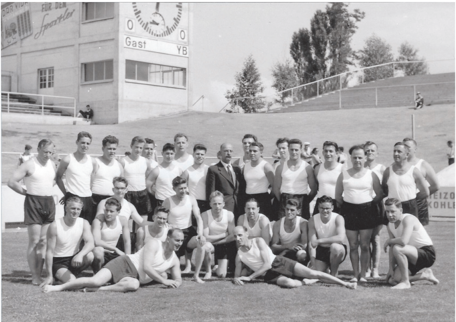
Jahr 1958, Gruppenfoto im Wankdorfstadion am Schweizerischem Verbandsfest in Bern

Nach diesem Erfolg kehrte wieder der normale Turnbetrieb ein. Mit der Einweihung des Schulhauses "Gemeindewiesen" wurden im Jahr 1959 die Turnstunden vom "Rosenberg" in die neue Turnhalle verlegt. Mit grosser Genugtuung darf auch noch festgehalten werden, dass ein starker jugendlicher Nachwuchs vorhanden war. Zusammen mit dem Musikverein "Harmonie" Neuhausen wurde wiederum