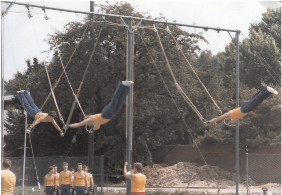
Jahr 1983. Schaukelring am Schweizerischen Verbandsfest in Basel

der Sportanlage "Gemeindewiesen" der Schweizerische Kunstturnertag SATUS/ SKTSV (Schweizerischer Katholischer Turn- und Sportverband) durchgeführt. Die gute Vereinsführung und die Kameradschaft zwischen den einzelnen Riegen ermöglichten es immer wieder, Anlässe aller Art zu organisieren. Es war erfreulich, wie sich die Mitglieder jeweils spontan für solche Arbeiten einsetzten. Trotz dieser Aspekte fiel 1981 unser Jodel-Doppelquartett der Zeit zum Opfer. Wegen Nachwuchsmangels musste die Auflösung beschlossen werden. Ein bedauerlicher Entscheid, der jedoch nicht aufzuhalten war.