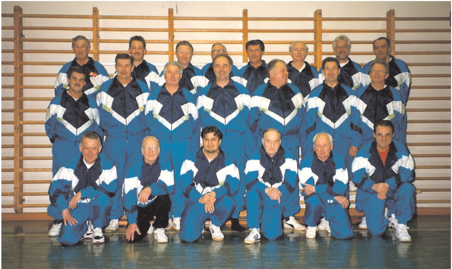
Jahr 1996. Männerriege

Das Jahr 2000 war in turnerischer Hinsicht eher ruhig. Nebst den normalen Turnstunden führten die Gruppen "Allez Hop" und "Rope Skipping" ihre Trainings durch.