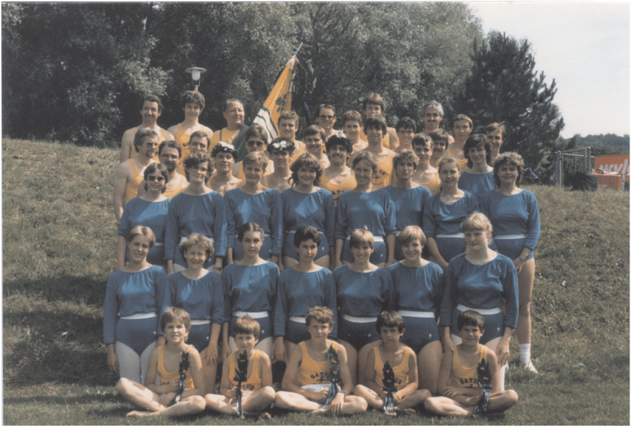
Jahr 1985. Aargauer Sportfest in Lenzburg

ner in diesem Jahr etliche Erfolge verbuchen, so den Meistertitel am SATUS Gerätefinal sowie gute Platzierungen in nationalen und internationalen Wettkämpfen.