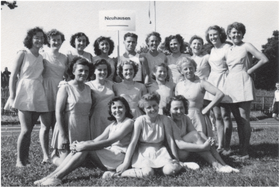
Jahr 1950. Turnerinnen am Verbandsfest in Lausanne

"Germania" (später "Union", heute Wohnblock neben Altersheim "Schindlergut"). Erfolgreich wirkte die Sektion am Zentralfest in Zürich in der höchsten Kategorie mit. Wichtige Ereignisse zeichnen das Jahr 1910 aus. Das "Volkshaus" wurde eingeweiht, so dass die Sektion nun ständig ihre Versammlungen und Anlässe dort abhalten konnte und endlich diese Lokalangelegenheit ihr Ende fand.