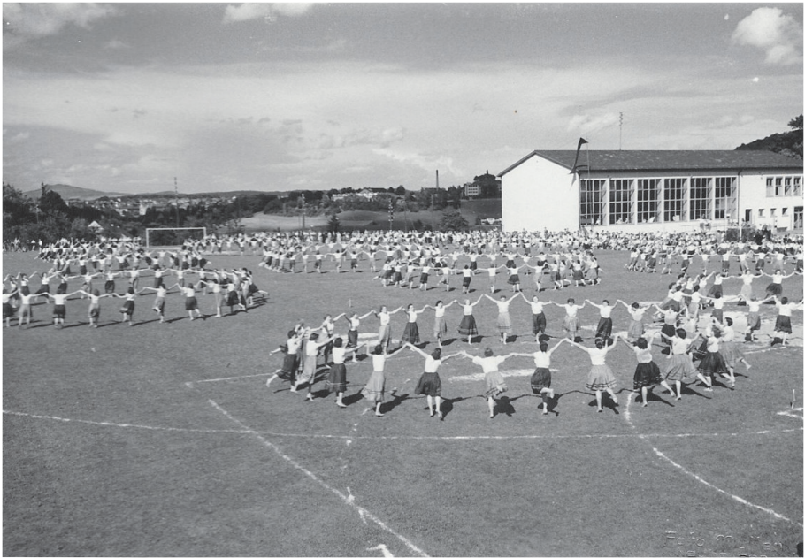
Jahr 1956. Fussballplatz Rosenbergschulhaus. Ostschweizerisches Turnfest

die Sektion dann vor, über Winterthur heimzufahren.