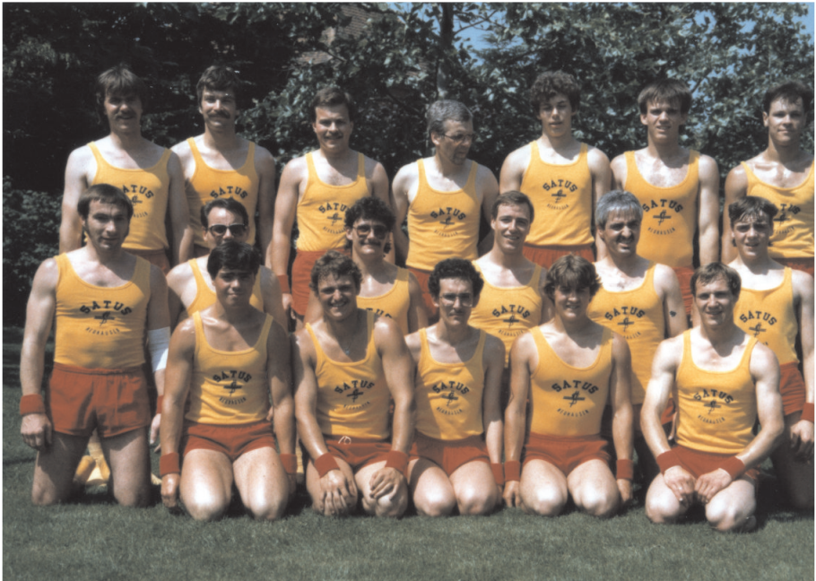
Jahr 1985. Aargauer Sportfest in Lenzburg

Das Jahr 1992 blieb eher ohne spektakuläre Höhepunkte. Bei der Kunstturnerriege gab es einen Wechsel in der Leitung. Nach vielen Jahren konnte die Turnersektion anlässlich des SATUS Sektionsturntages in Windisch nicht mehr an die bisherigen grossen Erfolge anknüpfen. Wie aus verschiedenen Jahresberichten her-