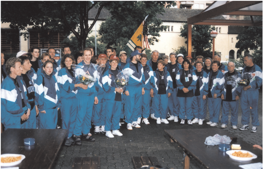
Jahr 1999, Feier auf dem Platz für alli nach Verbandsfest in Bern

Für die Hütte auf dem Randen wurden wiederum diverse Arbeiten verrichtet und zwei Holzherde ersetzt. Eine gutgelungene Abendunterhaltung in der "Rhyfallhalle" beschloss die Vereinsaktivitäten.