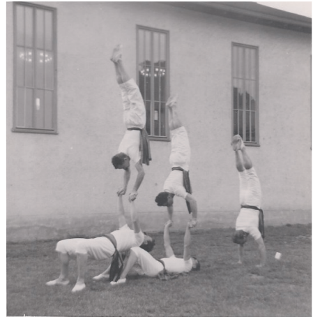
Jahr 1960. Akrobatik auf dem Kirchackerturnplatz

1963 gab es einen Wechsel an der Vereinsspitze, indem das Amt des Präsidenten und des Oberturners in jüngere Hände übergingen. Grossanlässe waren in diesem Jahre keine zu verzeichnen. Erwähnenswert ist jedoch, dass zum ersten Mal in der Vereinsgeschichte der ATV Neuhausen den Satusmeister im Kunstturnen stellte. Ebenfalls in diesem Jahr wurde der Grundstein zu einem lange gehegten