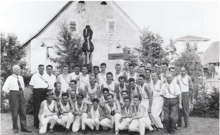
Jahr 1960. Turner am Ostschweizer Kreisturnfest in Dietikon

Das Jahr 1970 kann wiederum als Markstein in der Vereinsgeschichte bezeichnet werden. Der seit 1919 bestehende Vereinsname "Arbeiter-Turnverein Neuhausen" wurde in An-