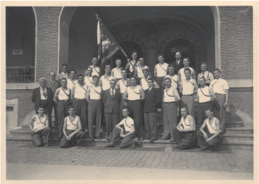
Jahr 1948. SATUS Turner vor Rosenbergschulhaus

Dass es ab 1907 unter den Mitgliedern oft wenig fruchtbare Zwistigkeiten gab und es scheinbar an jedem Kitt fehlte, den man Gesellschaftsgefühl und Solidarität nennt, war wohl der Grund, dass in den folgenden Jahren ein starker Wechsel in der Leitung stattfand. Im darauffolgenden Jahr weihte die Sektion das zweite Vereinsbanner ein. Und als neues Versammlungslokal diente das Hotel