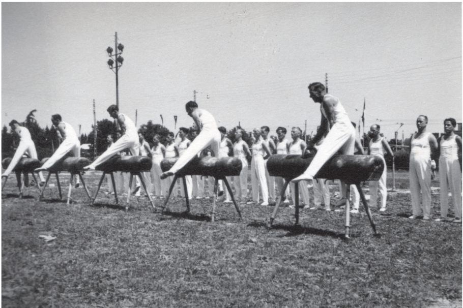
Jahr 1950. Pferdpauschen am Verbandsfest in Lausanne

rie den 3. Rang erzielte. An diesem Fest wurden zum ersten Mal in grossem Massstab die gelockerten, rhythmischen Freiübungen gezeigt. Es brachte aber auch viele übermässig erhitzte Debatten um die kleinen schwarzen Höschen. Ein Gegenstand also, der dieser Streitereien nicht würdig war, wenn man heute die Vielfalt der Turnbekleidung in Betracht zieht. Immerhin, die Neuhauser Sektion war die einzige in Arbon, die nicht in den kurzen schwarzen Turnhosen erschien. Ob zu ihrem Ruhme oder nicht, bleibt dahingestellt. Nebst dem Turnfest standen weitere Anlässe auf dem Programm, so unter anderem die Maskenbälle im "Volkshaus" und ein Gartenfest im "Volkshausgarten". Die Schwimm-