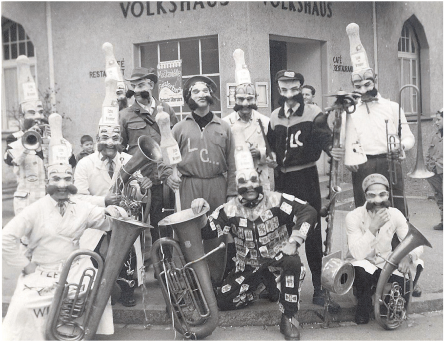
Jahr 1957, Fasnacht "Kegelklub vom Brenner"