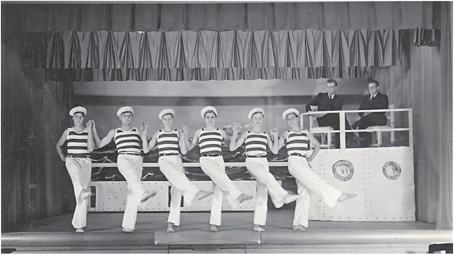
Jahr 1938. Abendunterhaltung im Volkshaus

fonds angelegt wurde. Dies schien aber der ungeduldigen Turnsektion zu lange zu dauern, so dass 1892 eine Sammlung von Haus zu Haus organisiert wurde, die offenbar eine schöne Summe ergab. Noch im gleichen Jahr wurde die erste Vereinsfahne eingeweiht. Sie war vom Pfrundhaus Schaffhausen für 365 Franken angefertigt worden. Patensektion war der Gemischte Chor Neuhausen am Rheinfall.