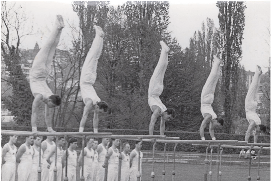
Jahr 1966. Schweizerisches Verbandsfest in Zürich

passung an den Zentralverband in "SATUS Neuhausen" abgeändert. Das XIII. Verbandsfest gelangte in Schaffhausen zur Durchführung. Die Sektion Neuhausen stellte sich ganz der Organisation zur Verfügung, so dass sie nicht an den Wettkämpfen teilnahm.