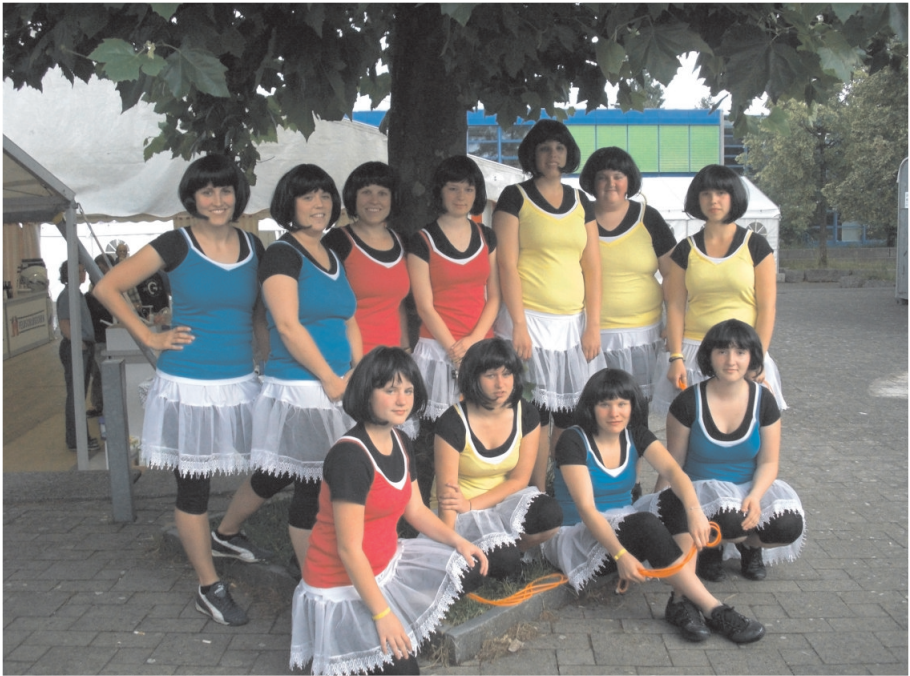
Jahr 2009, Turnerinnen am Sportfest in Oberentfelden

Verschiedenes hat sich gegenüber früher gewandelt. Es wurden strukturelle Änderungen vorgenommen. Die Interessen der Vereinsmitglieder haben sich geändert. Das Angebot wurde erweitert, was allerdings auch eine gewisse Zersplitterung der Kräfte mit sich brachte. Die schlagkräftige Turner-Sektion, die jahrzehntelang das Vereinsturnen im gesamten SATUS dominierte, gehört der Vergangenheit an. Dagegen durfte die Jazzriege in den letzten Jahren erfreuliche Erfolge feiern. Durch alle diese Veränderungen ist die Leitung des Vereins nicht einfacher geworden.