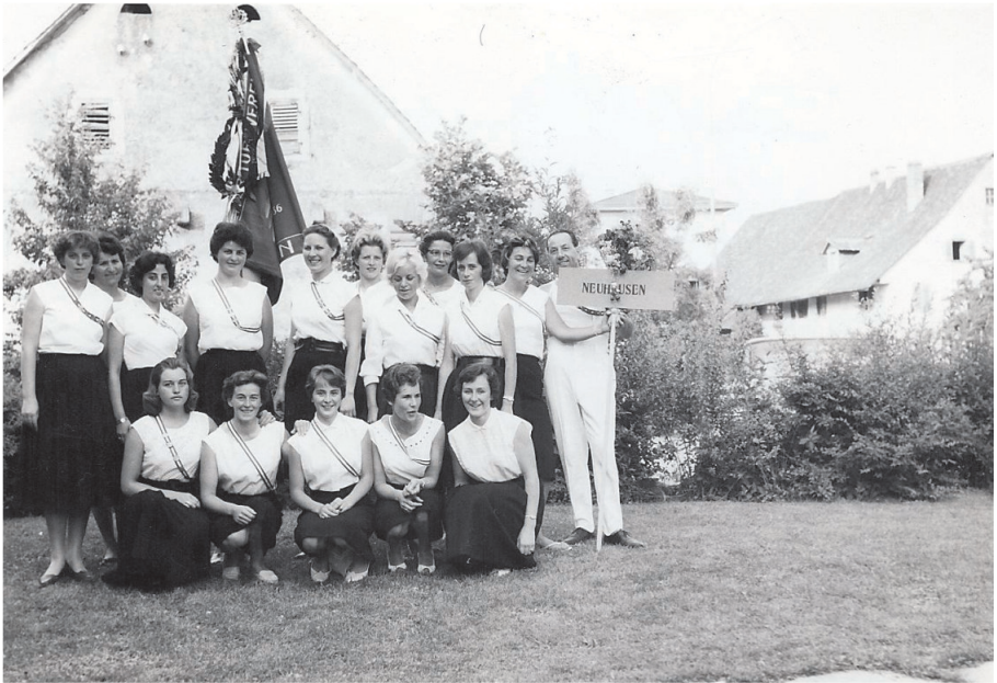
Jahr 1960, Turnerinnen am Ostschweizer Kreisturnfest in Dietikon

werk vorangetrieben, so dass noch im gleichen Jahr 1964 das Aufrichtfest gefeiert werden konnte. Im Folgenden nahm der Hüttenbau seinen Fortgang. Über 27'000.-- Franken waren bis anhin verbaut worden. Das meiste Geld wurde übrigens durch Spenden hereingebracht. Im Sommer 1965 führte der Verein letztmals ein Waldfest im "Stümpfer" durch.